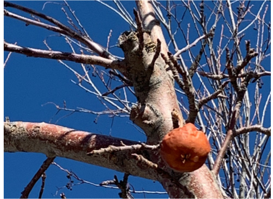
사과 연정 / 정선화