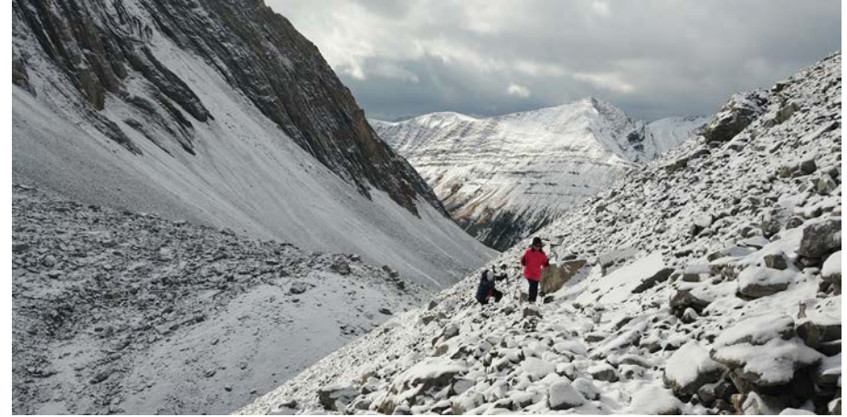
버킷리스트 / 인암 이진종

왜 사냐고 묻는다면 왜 오르냐고 묻는다면 흘러가는 삶결에 그분의 손길에 나를 맡기고 그냥 견디어내는 것이라고