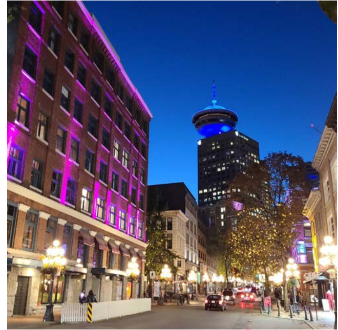
바람 그림자 / 전재민

바람이 그림자로 소리를 남겼다 그림자 쫓아가면 만날 수 있을 것 같아 소리만 쫓다 보니 꽃바람을 지나 단풍 흩날리는 가을바람.