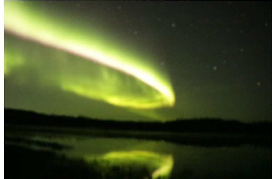
오로라(Aurora) / 신금재 (Anna Sin)

머나먼 우주의 시간 푸른 물이 흐르는 은하수 강가에 앉아 축복의 물을 부어주는 북두칠성 국자 그 푸른 빛